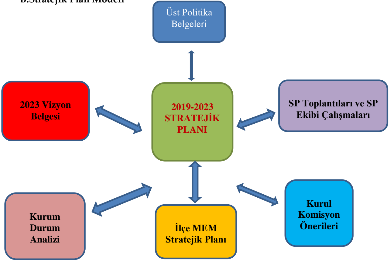
Stratejik Plan Oluşum Şeması